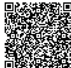
校园开放日报名 5月23日截止